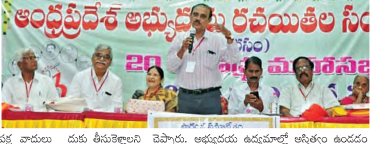
అరసం 23వ రాష్ట్ర మహాసభల్లో వక్తలు