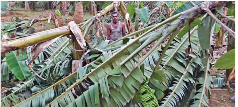
వీలిన ఈడు గాలులకు నారువ గ్రామంలో నేలకొరిగిన అరటి పంట

విజయవాడ, మే 23 ప్రభాతవార్త: ఏపీలోని కొన్ని ప్రాంతాల్లో శనివారం సాయంత్రం తరువాత భారీ గాలివాన బీభత్సం సృష్టించింది. ఏపీలోని ఆనకాపల్లి, కాకినాడ, తెలంగాణలోని నాగర్ కర్నూలు జిల్లాల్లో గాలిలో కూడిన వర్షం అల్లం లోలం సృష్టించింది. గాలివాన బీభత్సం కారణంగా ఏపీలో ఇద్దరు, తెలంగాణలో ఒకరు మృత్యువాత పడ్డారు. పలుచోట్ల విద్యుత్ సరఫరాకు అంతరాయం ఏర్పడింది. ఆనకాపల్లి జిల్లా నక్కపల్లి, పాచికరావుపేట మండలాల్లో దాదాపు అరగంబు పాలు గాలి, వాన రావడంతో చెట్లు, విద్యుత్ స్తంభాలు నెలకూలాయి. రమణయ్యపేట, ముకుందరాజుపేట, దోనల పాడు, వీడిక, జి.జగన్నాధపురం, గోడివర్ల, దొంకాడ, చినదొడ్డిగల్లు, కాగిత జాతీయ, రహదారి వంటి >>2